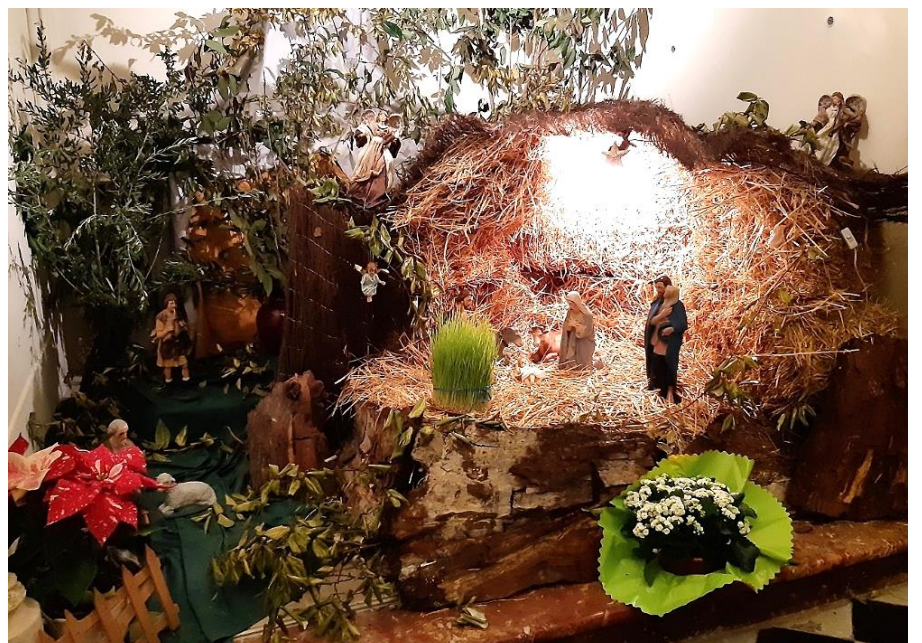
➤ Crèche de la chapelle du Monastère de la Visitation Sainte Marie de Tarascon