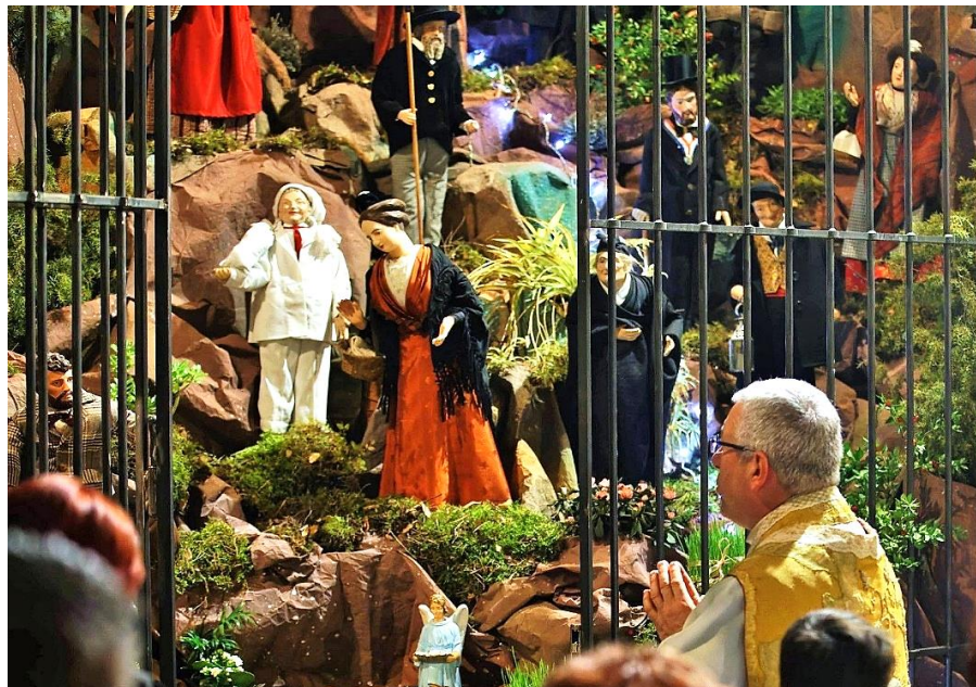
➤ Crèche de l'église Saint Joseph de Boulbon